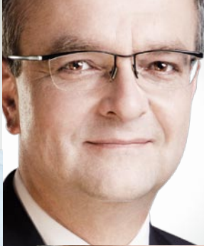
MIROSLAV KALOUSEK STŘEDOČESKÝ KRAJ